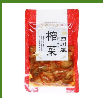
四川風榨菜 2パック